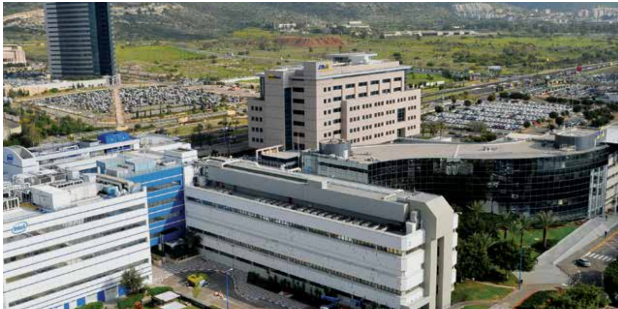
[למטה] בפארק ההייטק מתם, ממרכזי המו"פ החשובים בישראל, פועלות שלוחות של כמה מחברות הטכנולוגיה המובילות בעולם. הפארק נבנה במתכוון בחיפה בשל הקרבה לטכניון

הטכניון, ובנאסד"ק - יותר מ-50 חברות הנסחרות שם הוקמו ומונהיגות בידי בוגרי הטכניון. בנאסד"ק נסחרות יותר חברות מישראל מאשר מצרפת, גרמניה ובריטניה גם יחד. את המחקר ערכו הפרופסורים אמנון פרנקל ושלמה מיטל ואילנה דה-בר.