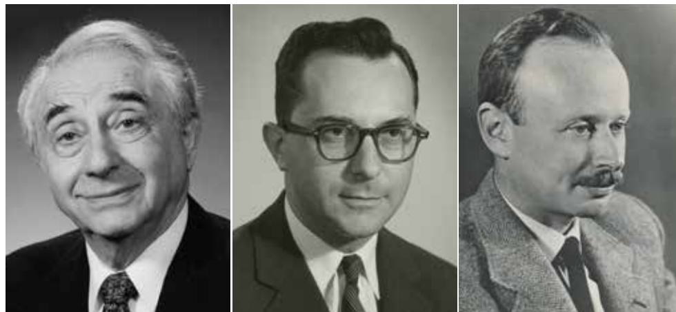
משה ארנס בימיו כמרצה בטכניון, 1960 עוזיה גליל