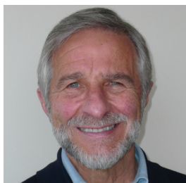
ד"ר ג'ורג' ג'. אלבאום ארה"ב

בהוקרה על מחויבותך הכנה לעתידה של ישראל באמצעות תמיכתך המסורה ב-ATS ובטכניון; ברגשי התפעלות מהישגיך העסקיים אשר גישרו בין ארצות; ובהוקרת תודה על מסר הסובלנות שאתה מפיץ לטובת האנושות כיום ולדורות הבאים.